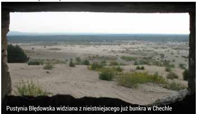
Pustynia Błędowska widziana z nieistniejącego już bunkra w Chechle

Na zachodzie pustynia sięga Błędowa (dzielnica Dąbrowy Górniczej), na wschodzie Klucz, na północy wsi Chechło (słynie z lokalnego produktu alkoholowego zwanego „Czarem Pustyni, jest tu też ładny punkt widokowy), a na południu ograniczają ją lasy. Średnia miąższość piasków to 40 m (maksymalnie do 70 m). Przez pustynię przepływa rzeka Biała Przemsza. Z zarośli i drzew oczyszczono kilkadziesiąt hektarów piasku. Długi czas związku z pracami wstęp na pustynię był zabroniony. Trzeba pamiętać, że ten największy obszar piasku w Europie od kilkadziesiątu lat jest też poligonem wojskowym; legenda mówi, że podczas II wojny ponoć ćwiczyli tu nawet niemieccy żołnierze z Africa Korps, na prawdziwość której