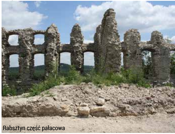
Rabsztyn część pałacowa

Na początku będzie klasycznie, bo o czymś, co jest najbardziej znaną atrakcją naszego regionu – o zamkach i warowniach. Zaczynamy w Olkuszu, na rynku, obok tzw. sztucznych ruin ratusza rozebranego w XIX w. Nim obiekt zostanie udostępniony do zwiedzania można zerknąć przez przeszklenie do jego średniowiecznych piwnic odkopanych przed kilku laty, podczas remontu centralnego placu miasta. Z rynku wyjeżdżamy ul. Augustiańską, obok murków, którymi zaznaczono ślady po ufundowanym przez Władysława Jagiełłę, a rozebranym w XIX w. kościele Najświętszej Marii Panny i klasztorze Augustianów. Następnie skręcamy w lewo, i ul. Kościuski jedziemy prosto, kierując się na Wolbrom. Droga nr 783 wspinając się na wzgórze Sikorka, skąd rozpościera się ładny widok na północ, dostrzeżemy już wapienne wzgórze z ruinami zamku w Rabsztynie (4 km od olkuskiego rynku).