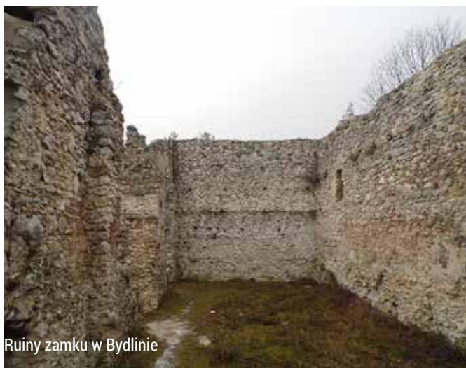
Ruiny zamku w Bydlinie

a wnet w następnej wsi – niegdyś, przez chwilę nawet mieście – Bydlinie.